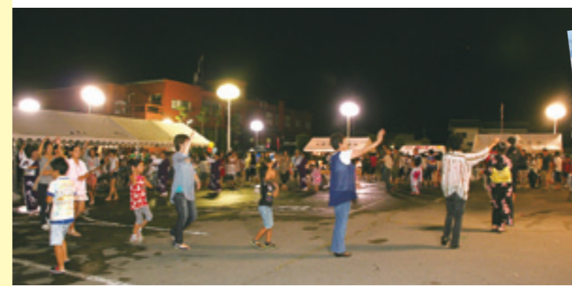
みんなで踊ろう郷土の踊り