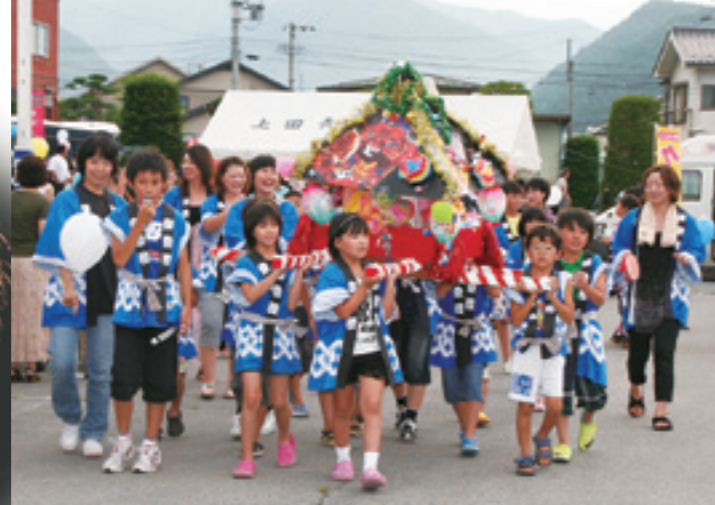
堀之内の天神なかよしみこし

また、14・15日には森林公園マレットゴルフ場の無料開放や親善スポーツ大会、親善囲碁大会が行われ、昨年復活した盆踊りは、やぐらを囲んで開催されました。お盆でふるさとに帰省された皆さんも加わり、世代を超えて楽しく交流が深められました。