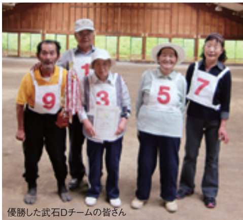
優勝した武石Dチームの皆さん