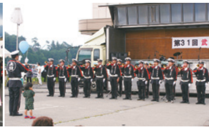
消防団のラッパ吹奏