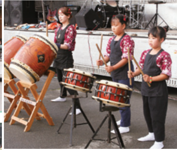
美ヶ原飛龍太鼓保存会の演奏