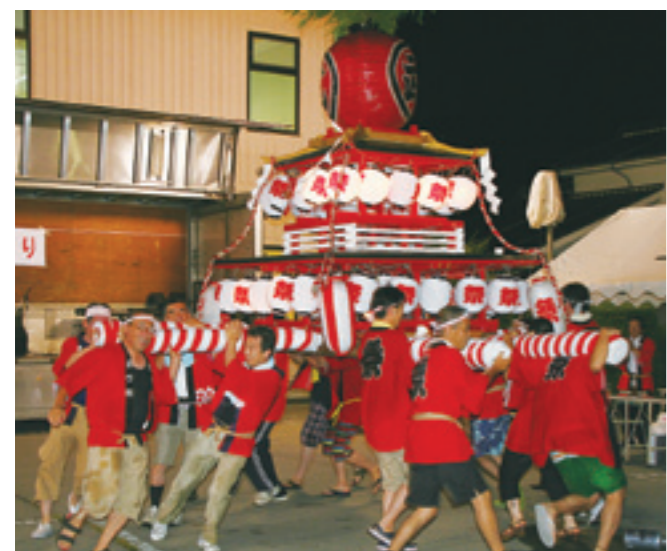
市職員の灯みこし