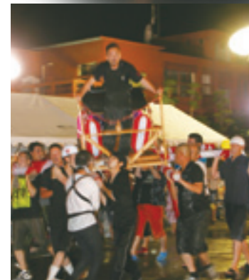
パーモンカーニバルみこし