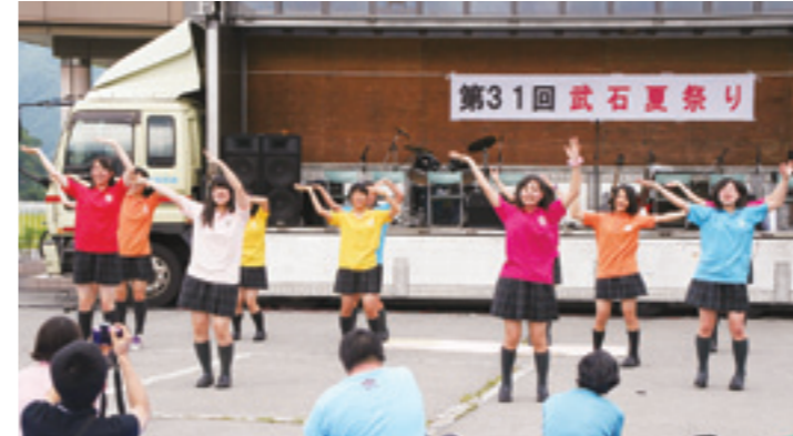
愛知県春日丘高校生徒によるAKBステージ