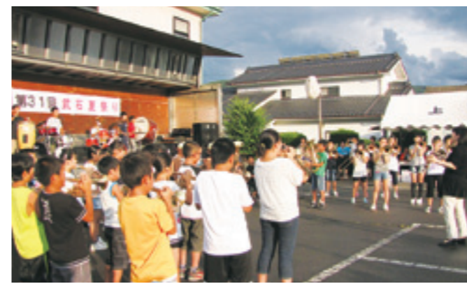
武石小学校金管バンド