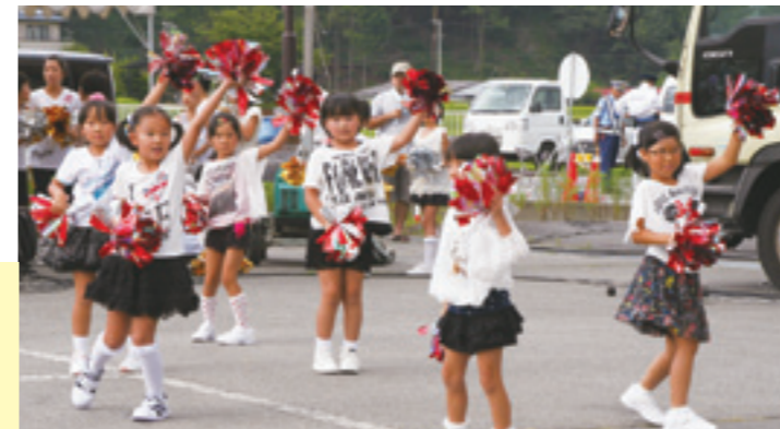
かわいいキッズダンス♪