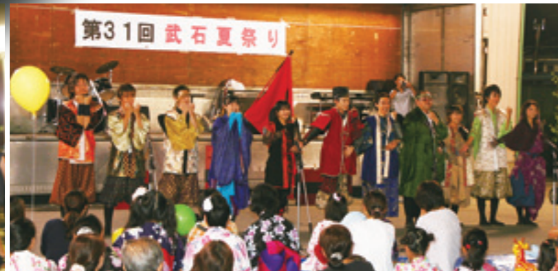
おもてなし武将隊～真田幸村と十勇士～