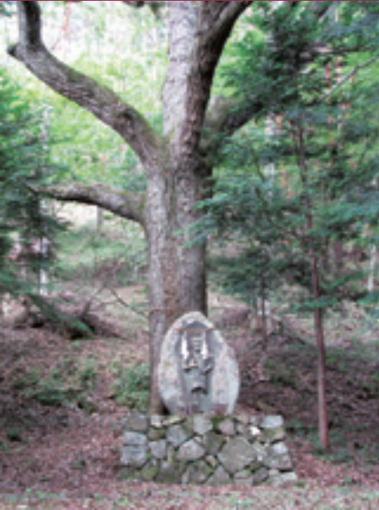
不動様とミズナラの大木

小沢根自治会では、今年度、わがまち魅力アップ応援事業の採択を受け、「獣害対策を活かしたふるさと（環境）づくり事業」を行っています。