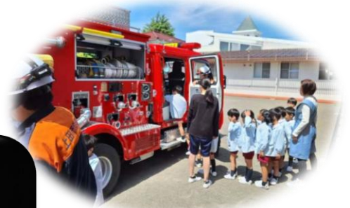
市内幼稚園の避難訓練