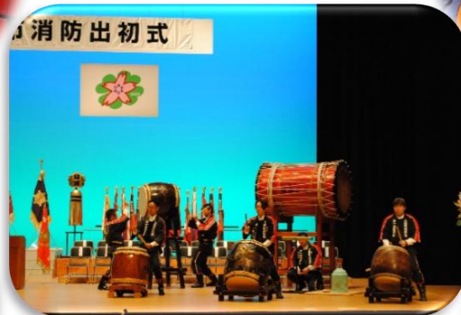
伝統技能 火消し太鼓