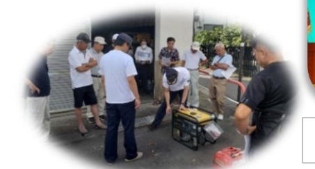
地域住民との防災設備講習