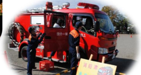
市内小学校でのイベント参加