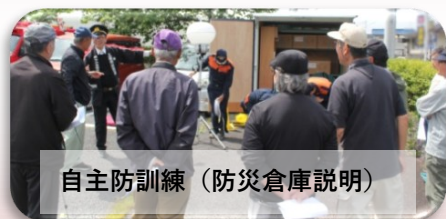
自主防訓練（防災倉庫説明）

第12分団は神科地区15自治会、北部地区2自治会の約7,500世帯を管轄しています。団員の負担になりすぎないように考慮しながら、小型ポンプなど機材の取り扱いや、年間を通し様々な訓練を実施しています。また、地域で行われる避難訓練、イベントへの参加を通して、火災予防の呼びかけや消防団活動を身近に感じてもらい、地域の無火災、無災害を目指して活動しています。自助、共助の知識を学びながら、自分の街は自分で守る、そして誰かの為に一緒に活動してみませんか。第12分団への入団のお申込み、ご質問は上記メールアドレスまで。