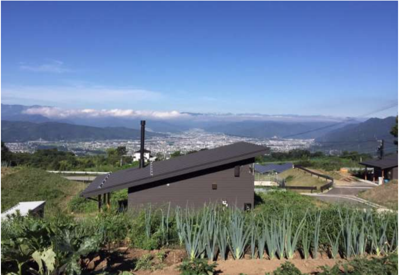
「 しんしゅう えだ 信州上田 ちょうぼう クライנגアルテン さと いわしみず 眺望の郷 岩清水」

「クライングアルテン」とは、ドイツ語で小さな庭という意味です。滞在ができる簡易宿泊棟を備え、一定の継続性を持った農作業を通じて農村地域の自然や文化及び人々との交流を楽しめるクライングアルテンは、都市住民の農村地域への関心を高め、荒廃の危機にある農村資源の保全や都市住民へのレクリエーションの提供といった機能を有しています。