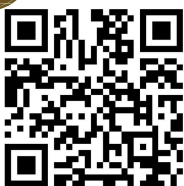
ふるさと住民ポータルアプリ 実証実験参加フォーム (NTTデータ)