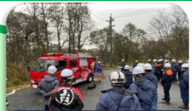
ポンプ車機関講習