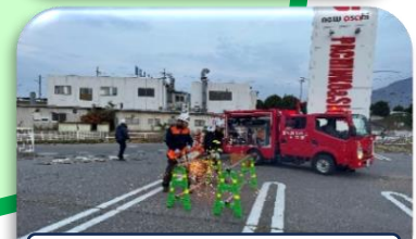
特殊車両による訓練