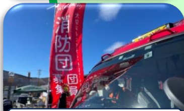
地元イベントでの広報活動