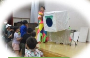
科学ワークショップ